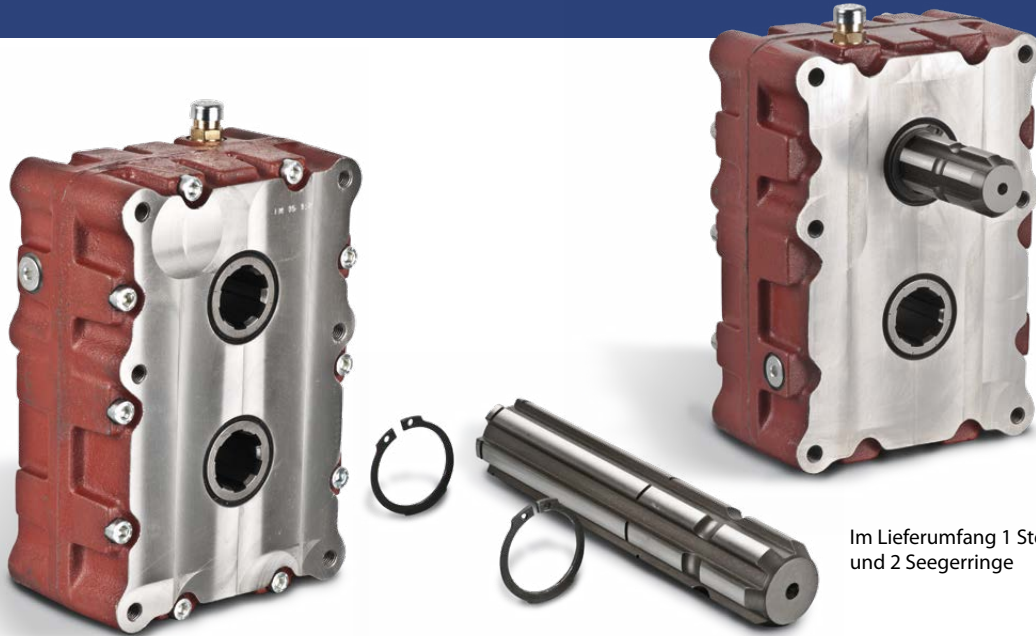
Im Lieferumfang 1 Steckwelle und 2 Seegerringe